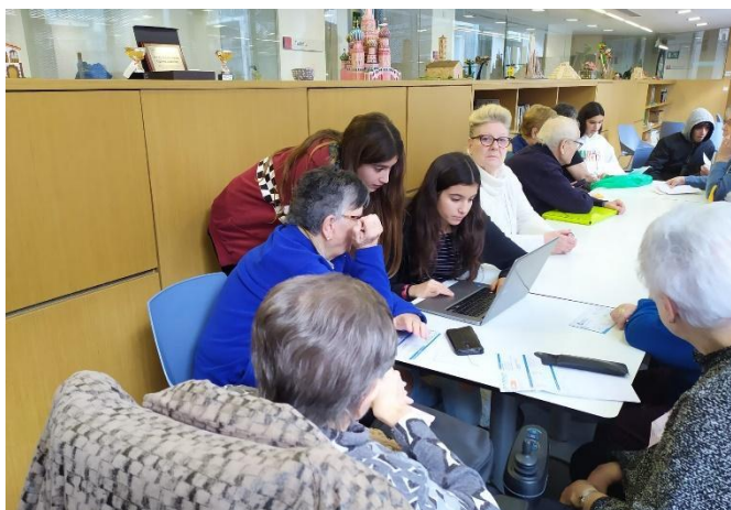
Fotografies (de dalt a baix):

Jornades d'intercanvi APS a un casal d'avis