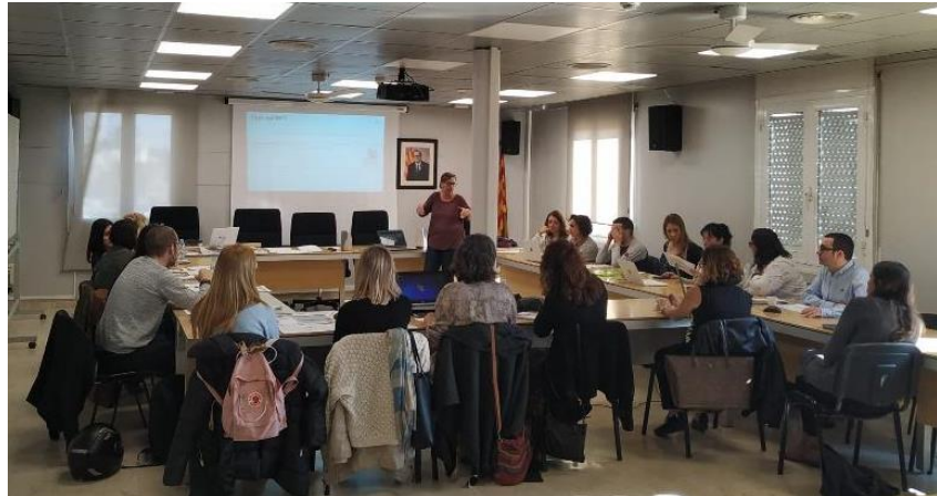
Fotografies (de dalt a baix i d'esquerra a dreta):

Taller d'apoderament energètic a l'hort de Mataró