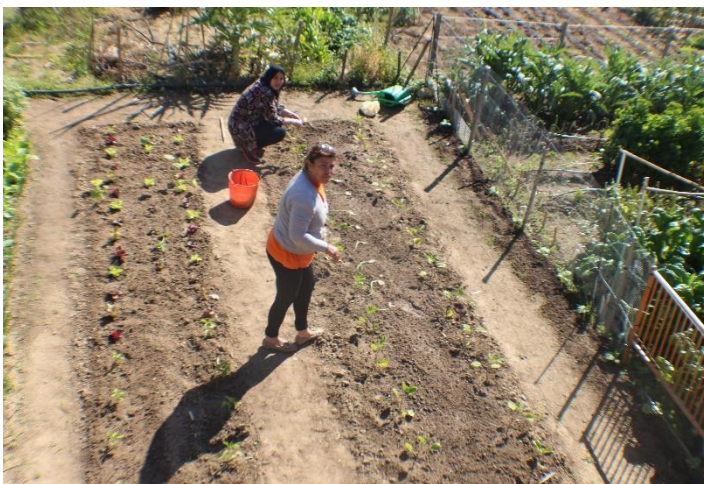
Fotografies (de dalt a baix):

Taller d'escocells a l'Aplec d'Agricultura Urbana Hort Social de Santa Anna de Premià de Dalt